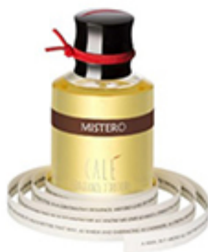
CALE Fragranze d'Autore. Una collezione di racconti olfattivi